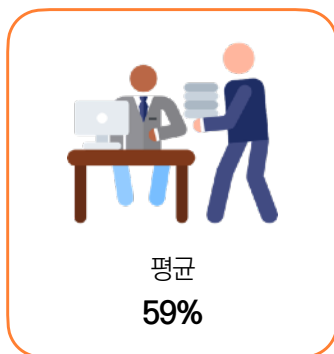
[그림] 삶의 만족도에서 직장 생활이 차지하는 비중

*자료 출처 : 나우앤서베이, 대한민국 직장인 삶의 만족도 설문조사 결과, 2023.08.21.(나우앤서베이 전국 직장인 패널 1,000명 대상, 온라인 조사, 2023.08.03.-08.09.) ( https://www.nownsurvey.com/board/hotissue/view/wr_id/173/ptype/all/stx/ )