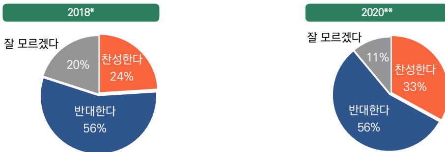
[그림] 난민 수용에 대한 의견(2018년 vs 2020년)