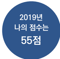
[그림] 2019년 본인 평가(100점 만점) (%)